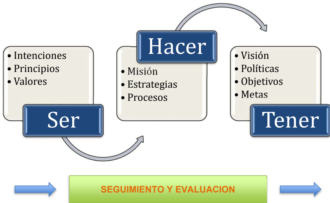
Figura 1 Modelo de planeación