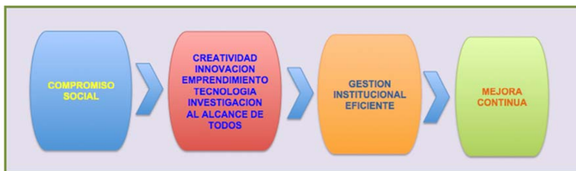
Figura 2 Ejes estratégicos modelo de planeación